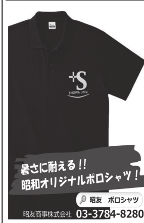
昭和大のオリジナルポロシャツ 昭和大ポロシャツ 昭友商事株式会社 03-3784-8280