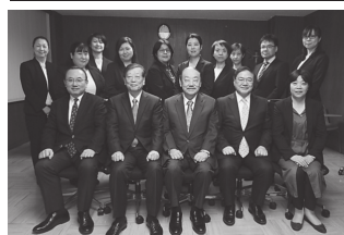
看護記録の取組の様子