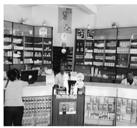
マダガスカルの薬局

私たち学生は今回の医療協力で見学やフィールドワークなどを行いました。手術見学では、術野での見学をさせていただきました。薬学部学生は手術室に入って見学することがほとんどありません。実際、日本で手術見学をしたことがなかったのが今回が初めての体験でした。執刀医、麻酔科医、看護師がどのようなことをしているかという連携