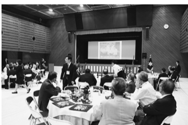
若き頃の卒後50年の出席者を写したスライドショー

今年度はブロンズ表彰(卒後15年)となる4回生(医療短期大学4期生)が招待された。表彰学年代表者には小出良平学長から表彰盾が贈呈され、出席者は、なつかしのキャンパスで旧交を温めた。また、10月27日と28日の2日間で第22回緑風祭が開催され、ステージ企画や各種模擬店に各学科の体験コーナー、さらに教員によるバザー&カフェが開かれ、キャンパス内は大変賑わいを見せた。