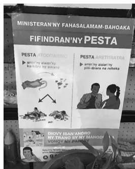
ベスト対策のポスター

私は公衆衛生やインフラストラクチャーに興味があり本プロジェクトに参加しました。日本で生活していると、交通や水道、電気など全てのインフラが高水準