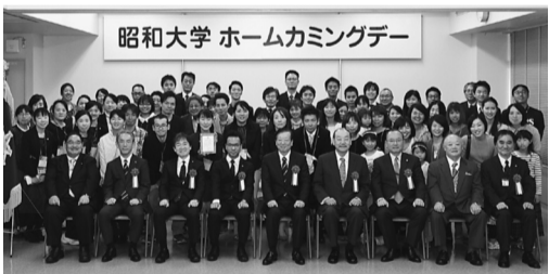
昭和大学 ホームカミングデー