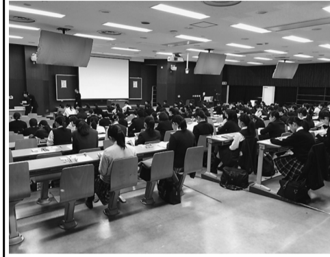
試験開始を待つ受験生

推薦入試・編入学試験を実施 大学・看護専門学校合計で198名が合格 平成31年度推薦入試・編入学試験が11月3日、旗の台キャンパスで実施され、ことしの受験シーズンが始まった。 ことしの志願者数は昨年と比べ、4学部合計で13名の増加となった。 11月4日には医学部附属看護専門学校でも試験が行われ、昨年と比べ志願者数は27名増加した。 志願者数および合格者数は表のとおり。