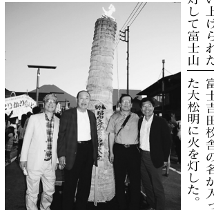
北口本宮富士浅間神社近くの大松明に火を灯した。