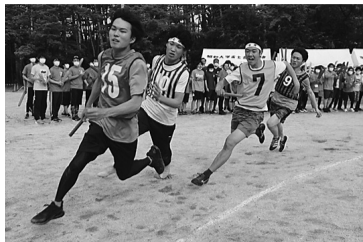
サークル対抗リレー