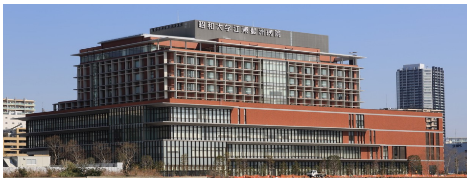
昭和大学江東豊洲病院