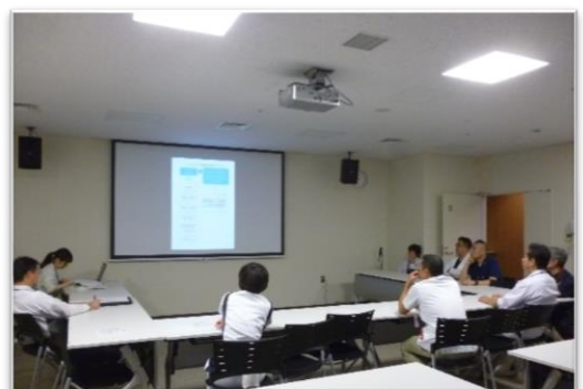
ミーティングの様子