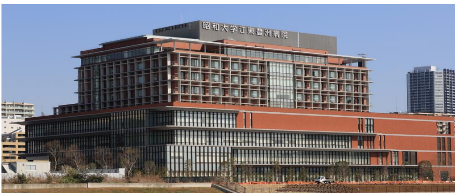
昭和大学江東豊洲病院

開院以来丸4年間の診療実績を基に、今回ご紹介した新しい低侵襲心臓弁膜症治療以外にも多くの先進的治療の施設基準をクリアし、これからさらに最先端の治療が行える施設へと飛躍しようとしています。地域の皆様にワールドスタンダードの循環器診断・治療を提供できる循環器センターとして努力し続けて参ります。これからもよろしくお願い申し上げます。