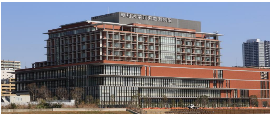
昭和大学江東豊洲病院