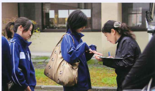
身だしなみのチェック