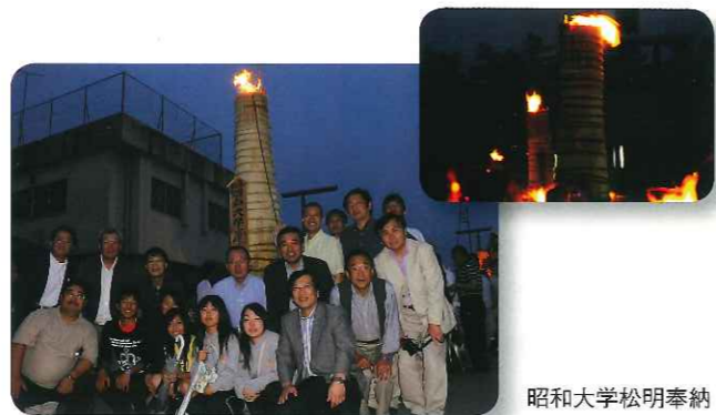
昭和大学松明奉納

毎年8月26日に行われる吉田の火祭りは静岡県島田の帯祭り、愛知県の国府宮のはだか祭りと並んで日本三奇祭の一つに数えられる有名なお祭りです。当日は多くの観光客や出店が祭りの雰囲気より盛り上げ、18時頃になると松明に火が灯され、このように街は火の海のようになりとても幻想的な姿になります。年に一度のお祭りですが皆さんもご覧になってみてはいかがでしょうか。