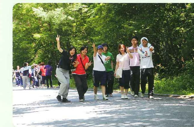
コースはじめは元気よく

にはコースを後戻りしながらもみんな仲良く無事にゴールインしてくれ本当に若さがまぶしい一日でした。