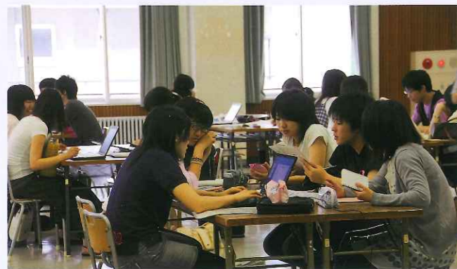
発表前の資料づくり