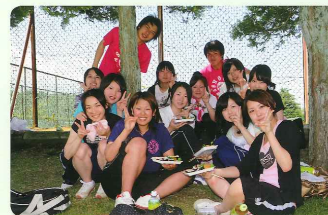
昼食でまた元気に