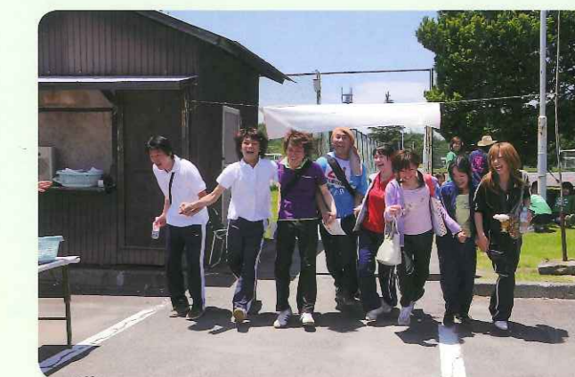
全員無事ゴール(かなりバテぎみです)