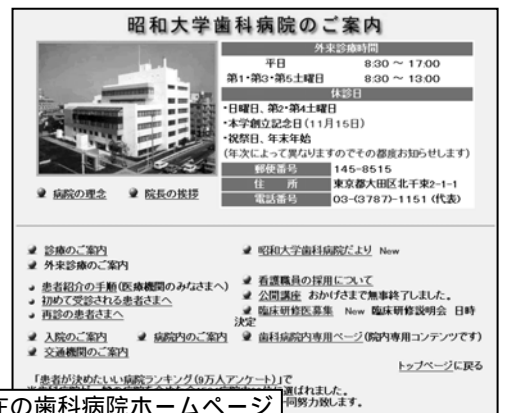
現在の歯科病院ホームページ