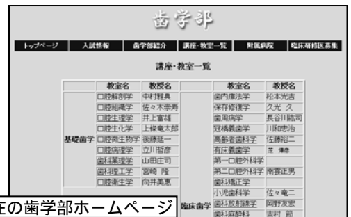
現在の歯学部ホームページ