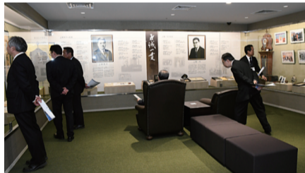
上條記念ミュージアム