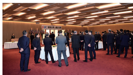
バンケットルームでの祝賀会

5月8日より学内関係者を対象とした内覧会を行い、11月10日から一般公開となる。