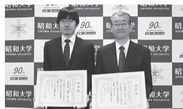
(左から)藤原博士兼任講師(医学部生理学講座生体制御学部門)、久光特任教授

本特許は天然由来の植物を用いることで安全性を確保し、皮膚、毛髪黒化促進に優れた効果を示す黒化促進剤、外用剤、飲食品を提供することを目的としている。