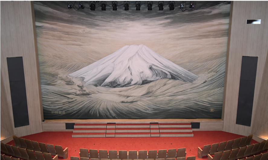
上條ホールに設置された緞帳「黎明」

成を祝福した。 施設内覧では、多摩美術大学名誉教授で日本画家である中野嘉之氏の原画「黎明」を基に製作された上條ホールの緞帳が披露された。 今後はランドオープン記念公演として各種イベントが予定されており、11月10日には昭和大学創立90周年記念式典が開催される。