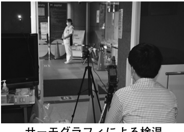
サーモグラフィによる検温

大学全体で取り組む 新型コロナウイルス対策 本学では大学全体で新型コロナウイルス対策に取り組み、基礎系教育職員、歯科医師、保健医療学部職員、看護専門学校教育職員、大学事務員等の中から有志を募り、業務支援のため各附属病院に赴いている。病院では患者への問診や検温のほか各種業務を行っており、今回の非常事態においても、PCR検査が可能となっている。