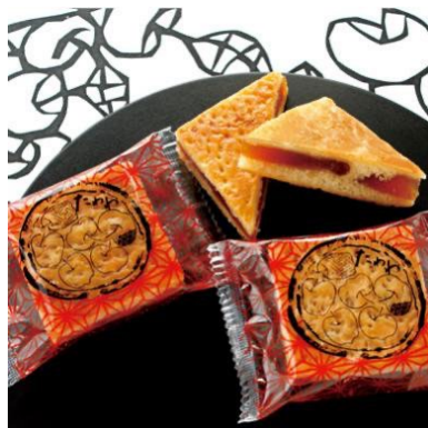
おきな屋（青森）たわわ