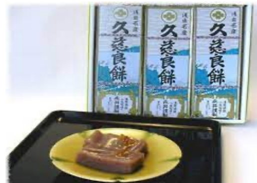
永井久慈良餅店（浅虫温泉）久慈良餅