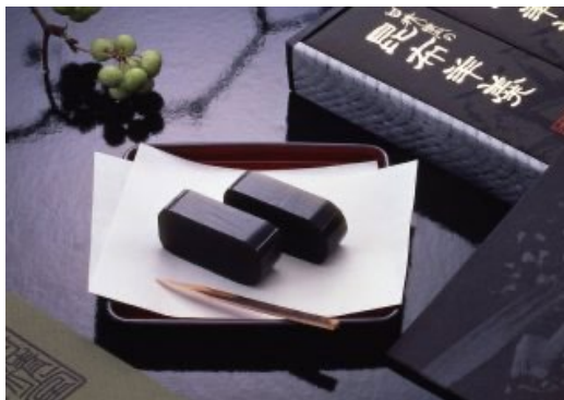
甘精堂（青森）昆布羊羹