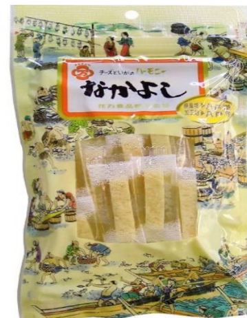
花万食品（八戸）なかよし