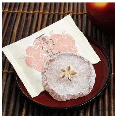
おきな屋（青森）薄紅