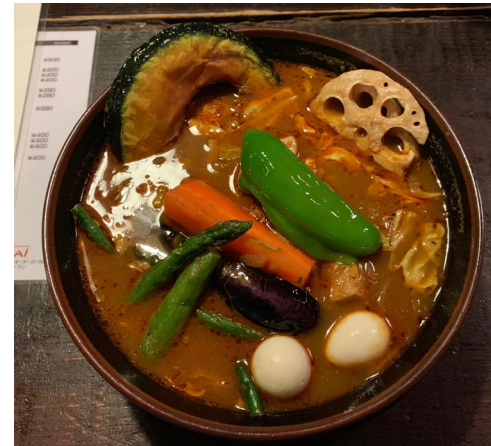
札幌スープカレー「ラマイ」 ランキング10位内に入る人気 店です。札幌に行った際には ぜひどうぞ。