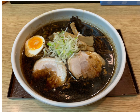
すすきので不動の人気 「いそのかづお」 札幌ラーメンは味噌ばかりでは ありません。札幌ブラック を並んででもご賞味あれ。