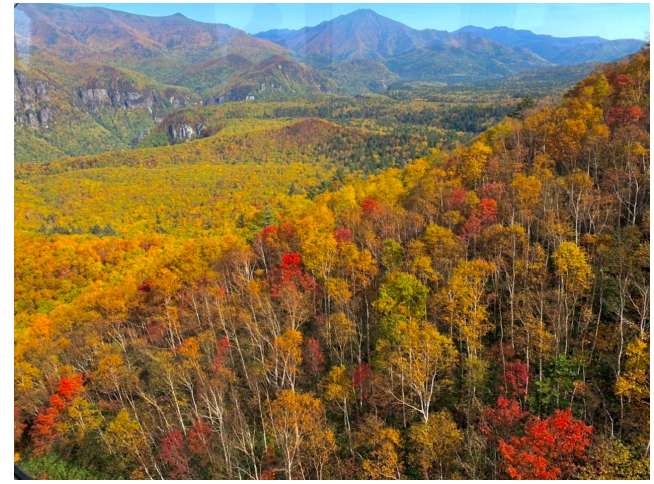
北海道の大屋根 大雪山層雲峡「黒岳」