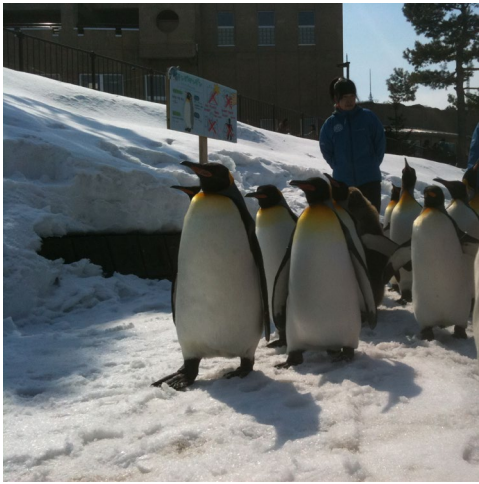
ペンギンのお散歩 旭川「旭山動物園」