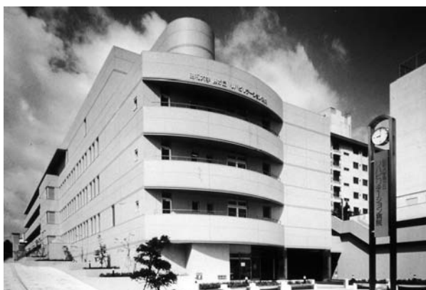
昭和大学藤が丘リハビリテーション病院

本病院の特色は、大学附属病院として数少ないリハビリテーション専門病院であり回復期リハビリテーション病棟を有しています。総合リハビリテーション施設を最大限に活用して脳血管疾患、骨・関節疾患、脊髄・脊髄疾患、切断、神経・筋疾患、循環器疾患、呼吸器疾患、小児疾患等の幅広い領域にわたるリハビリテーション医療を行っています。また、平成21年9月より藤が丘病院から眼科が全面的に移行し、手術室を眼科専用にして、毎日手術が行える体制を整えました。本病院は昭和大学の一施設として、医学部をはじめ、薬学部、保健医療学部の学生実習の場を担っており、他大学の学生や現職者の実習・研修の場としても機能を発揮しており、臨床研修病院群の一つとして鋭意活動しています。また、スポーツ科学研究所も併設しており研究にも取り組んでおります。本病院は、大学病院としての使命でもある教育・研究に力を注ぎ、教職員の資質の向上のみならず、より優秀な専門職を目指す後進の育成にも情熱をもって取り組んでいます。将来、リハビリテーション医療や地域医療を目指す研修医の皆様方にとって有意義な研修病院として活用いただけたらと思います。