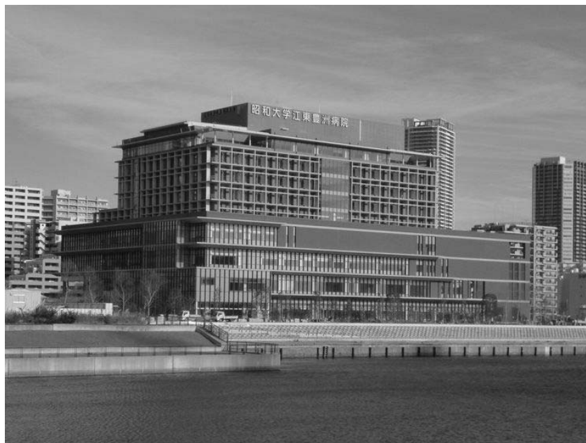
昭和大学江東豊洲病院

当院では、この様な充実した医療環境の中で臨床研修の目的であるプライマリ・ケアを経験し、最先端の医療を学ぶことが可能であります。さらに、研修目的で来日・来院する外国人医師が多数在籍していることで交流することが可能であり、国際化に対応しうる医学教育の環境が整備されています。また、周辺地域の豊洲市場の開場、近隣のタワーマンションの建設などの急激な開発に伴い、急増する患者さんに対応すべく開院時300床だった当院の病床数も2019年には400床に増床となり、より多くの症例を経験することが可能であります。臨床研修医の生活環境も徒歩3分の場所に病院と同時期に建てられた職員寮の使用ができ、快適な環境の中で臨床研修を行い、多くの成果を挙げることができると確信しています。