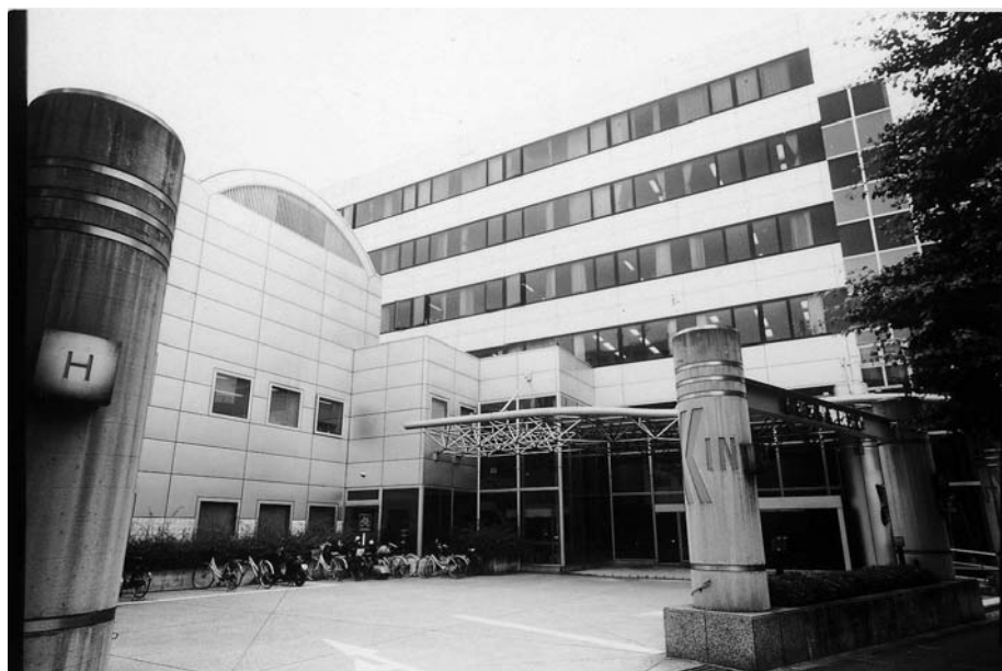
昭和大学病院附属東病院

平成11年4月に昭和大学病院から分離独立し、昭和大学病院附属東病院として開院、現在に至っております。昭和大学病院と有機的に連携連動し両病院一体となった運営を行いつつ、卒前教育、臨床研修および大学病院としての高度医療に全力を注いでいます。