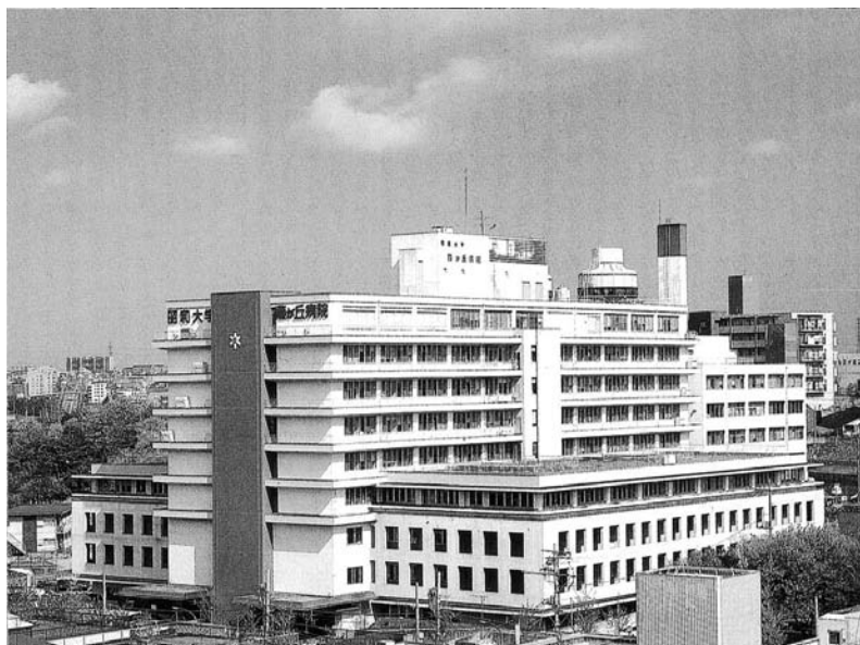
昭和大学藤が丘病院

2年間の臨床研修において最も大切なことは、指導医の指導のもと患者さんをしっかりと自分で診て自ら学ぶことです。そして独り立ちするには十分な症例を診ることが必要です。もちろん独善的にならないよう指導体制もしっかりしたものでなければなりません。様々な患者さんを診ることができ、伝統に裏打ちされた指導体制の整った当院は臨床研修には最適の環境だと自負しています。是非とも意欲ある積極的な医師の参加を募ります。