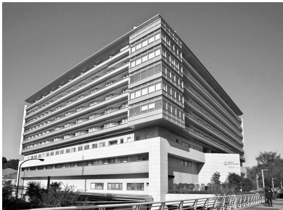
昭和大学横浜市北部病院

本病院は横浜市医療計画の地域中核病院の一つであり、地域がん診療連携拠点病院、地域医療支援病院に認定されております。また、西棟メンタルケア病棟がスーパー救急として高度精神科医療を経験できるなど、様々な社会のニーズに対応できるよう有機的な改編を繰り返しながら、地域医療への更なる貢献を目指しています。