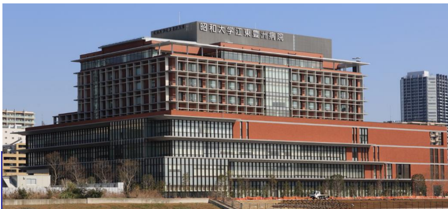
昭和大学江東豊洲病院

具体的には、腎炎や糖尿病など腎不全の原因の治療、高血圧・高コレステロール血症・肥満などの生活習慣病の是正、食事療法(塩分制限・蛋白制限)などが大切になります。慢性腎臓病が心配な方や今まで検査を受けたことがない方、健康診断で蛋白尿や血尿などの尿検査異常や腎機能障害を指摘された方は、いつでも当科までお気軽にご相談下さい。