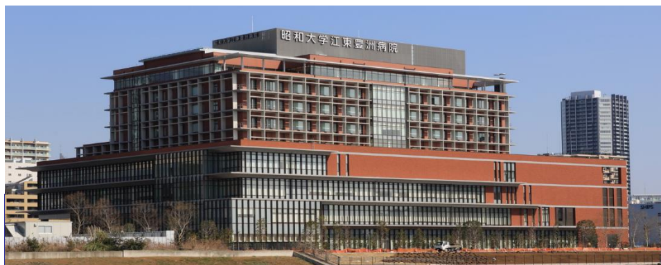
昭和大学江東豊洲病院