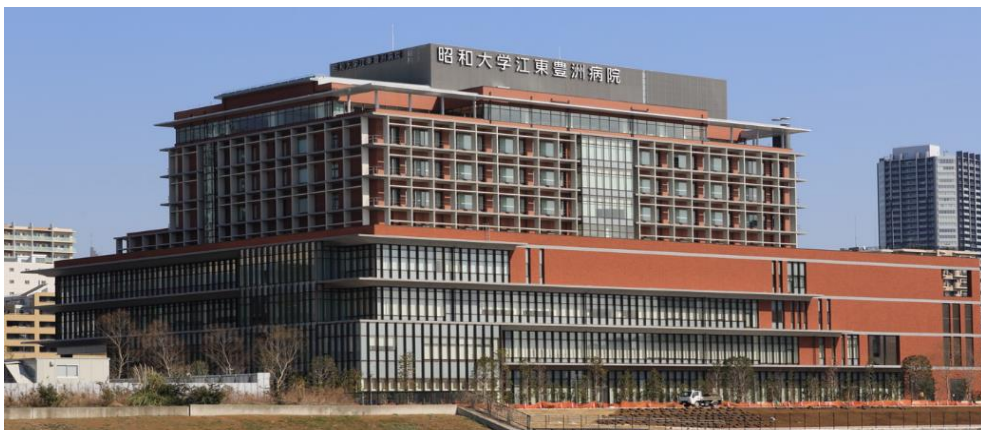
昭和大学江東豊洲病院

皮膚科疾患は接触皮膚炎（かぶれ）やアトピー性皮膚炎などの湿疹・皮膚炎群、蕁麻疹、乾癬、脱毛症からざ瘡（にきび）、 ほうかしかえん 蜂窩織炎等の細菌感染、带状疱疹、水痘、麻疹、風疹、手足口病、尋常性疣贅等のウィルス性疾患、足白癬皮膚（水虫）などの糸状菌症といった感染症、さらに、 ゆづせい 薬疹、熱傷（やけど）、血管炎や膠原病などの全身疾患関連皮膚障害、皮膚腫瘍まで多岐に渡りますので、医師4人がそれぞれの専門性を生かして診療に当たります。モデルやミュージシャンの方が公表し、理解が深まっている尋常性乾癬の治療に加え、 しょうせきのうほうしょう 掌蹠膿疱症、難治性の蕁麻疹やアトピー性皮膚炎でも生物学的製剤による治療が可能になりました。当院は、必要な検査後、使用可能なすべての生物学的製剤が直ぐに使用出来るので幅の広い、最適な治療が患者さんのご希望に応じて最短で開始できる数少ない生物学的製剤承認施設であると言えます。当科が有するエキシマ光線療法は尋常性乾癬、掌蹠膿疱症、アトピー性皮膚炎については生物学的製剤との併用が可能であり、特に尋常性白斑に対しては効果の高い治療法の一つに挙げられます。昭和大学の理念である「チーム医療」の実践として形成外科、リハビリテーション科、循環器内科、薬剤師、管理栄養士、皮膚・排泄ケア認定看護師、フットケア指導士、ストーマ認定士、義肢装具士と創傷治療チームを作り、フットケアや下腿皮膚潰瘍、褥瘡、ストーマや経管栄養部周囲の皮膚障害の治療に当たっています。以上の専門性を生かした治療も含め当科受診をご希望される場合は紹介を受け、当科の初診を予約されて来院していただければ幸いです。初診担当医が診断したうえでそれぞれの皮膚疾患に対応する専門外来での治療をご提案させていただき、これまで以上に Activity of daily living、quality of life を重視し、在宅医療も含め、各方面の医療機関、医療関係者と連携・協力し、life style に応じた、患者さん中心の医療を心がけていきます。