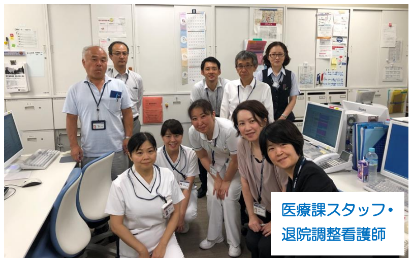
医療課スタッフ・ 退院調整看護師

総合サポートセンターは、今後も患者さん・ご家族が安心して病院・地域で過ごすことができるよう様々な取り組みを継続していききたいと思います。