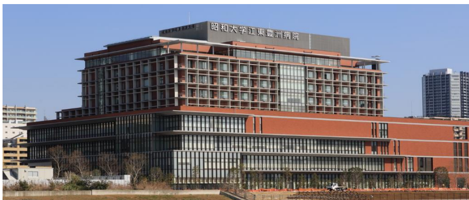
昭和大学江東豊洲病院