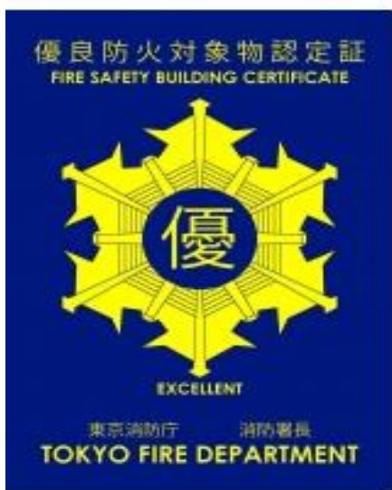
優良防火対象物認定証