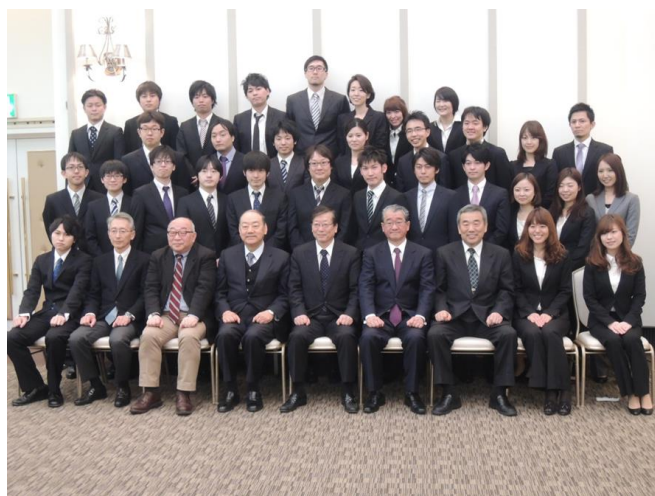
初期臨床研修医修了式