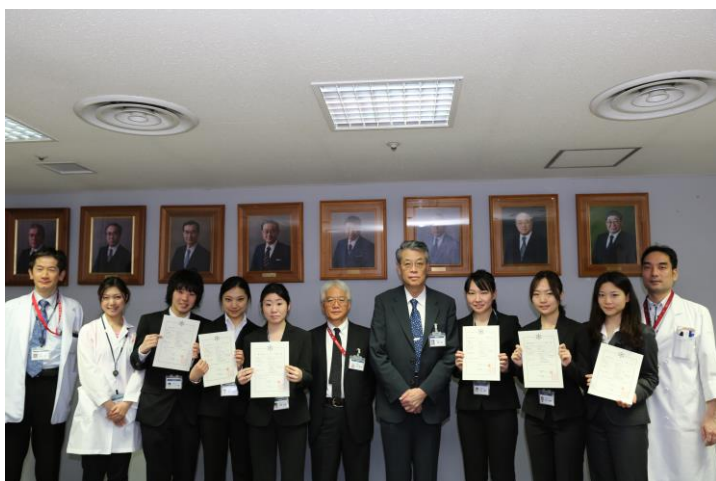
薬剤師レジデント修了式

平成 27 年 3 月 17 日(火) に薬剤師レジデント修了式、平成 27 年 3 月 25 日(水) に初期臨床研修医修了式を行いました。薬剤師レジデントと研修医が所定のカリキュラムを終え、修了証書が一人ひとりに手渡されました。