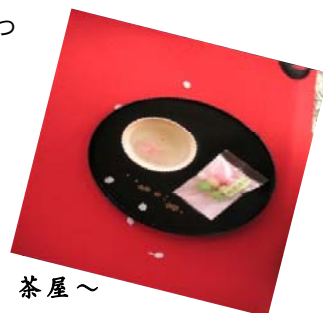
京都～平野神社 茶屋～

れまた、ほんとうにお恥ずかしい話ですが、私もツライ経験をしております。ある年の暑い夏でした。どうも眠りが浅く、連日かなりの頭痛が続きました。親も血管系の持病があったため、とうとう自分にも来たか、と覚悟を決めて脳外科で検査してもらったことがあります。そうしたら、全く異常は無く、単なるストレスでしょう、とのことでした。様々な検査をしている最中には全く気づかなかったのですが、そう言われたとたんに、アッ、もしかすると噛み合わせが変わったか!? と気がつきました。案の定、噛み合わせを楽にする装置を作ってもらい、寝る時につけていたら一週間ほどで頭痛が消えていました。顎の筋肉の緊張が原因だったのです。あ～あ、学生さんには噛み合わせの重要性を教える身でありながら、何たる失態でしょう。以降、講義では必ずこの話をしております。今、この病院に通われている皆様が早く治られて、おいしいものを食べられるようになることを心からお祈りしております。