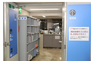
事務課管理係 入口

病院運営において前述した内容以外にもできる範囲でサポートしていきたいと思っておりますので、何かございましたらお気軽に事務課管理係へお問い合わせください。