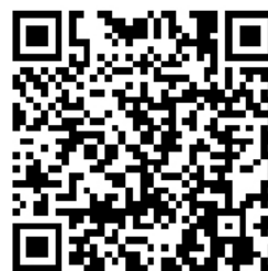
特別予約診療外来ホームページ QRコード

※予約時刻より30分を超えて診療開始された場合には特別予約料は徴収いたしません。