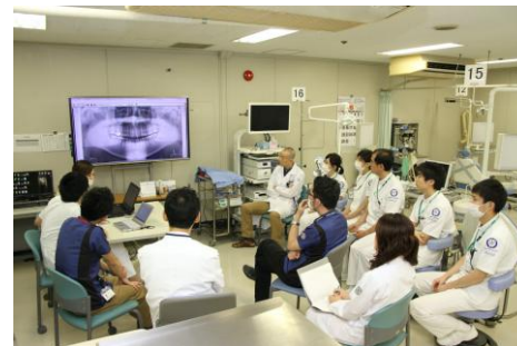
外来カンファランス