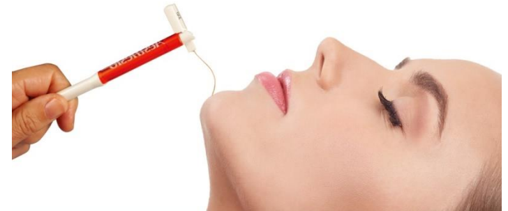
セメスワインスタインモノフィラメント(SWテスター)

歯源性歯痛と非歯源性歯痛を鑑別するためには、まず歯および歯周組織の状態を把握するための基本的な検査の手技を身に付ける必要があります。