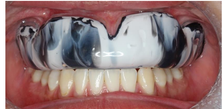
スポーツマウスガード