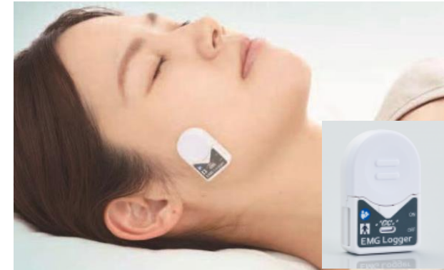
歯ぎしり検査用ウェアラブル筋電計 株式会社ジーシー ホームページより