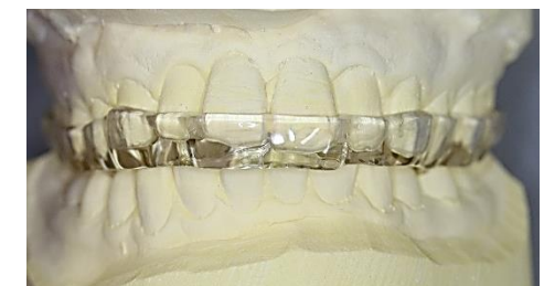
アプライアンス療法