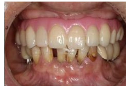
最終上部構造装着