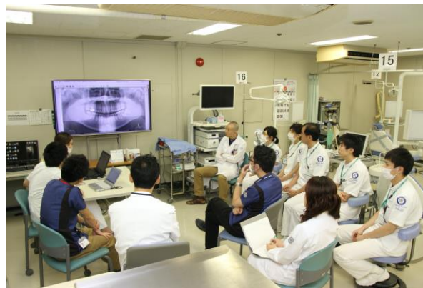
外来カンファランス