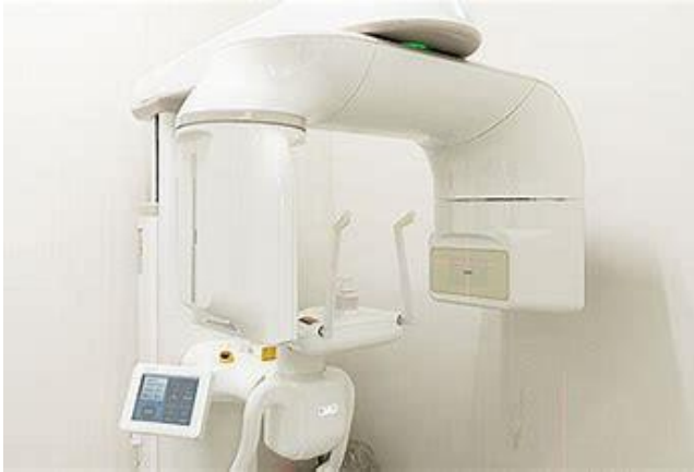
歯科用コンビームCT