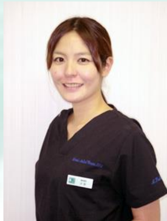
日本歯科大学 臨床約10年