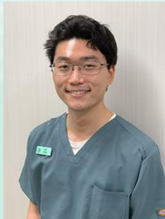
日本大学 臨床約4年