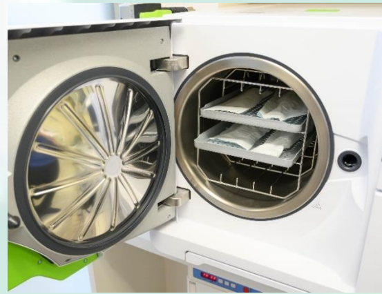
リサ クラスBオートクレーブ

ミーレ、リサを導入 手袋、タービンはもち ろんのこと3wayシリン ジの先もディスポを使 用し徹底した感染対 策を行ってます！