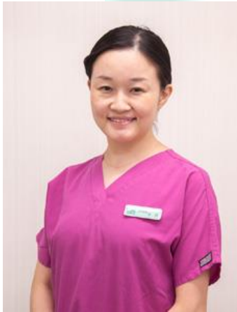
北海道大学 臨床約20年