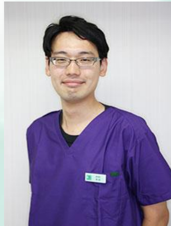
九州歯科大学 臨床約10年