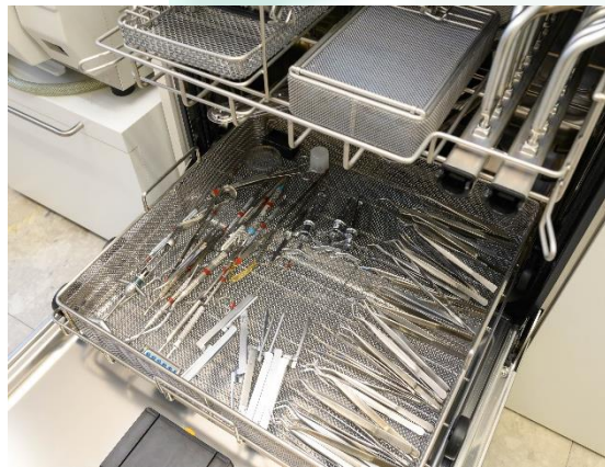
ミーレ ジェットウォッシャー