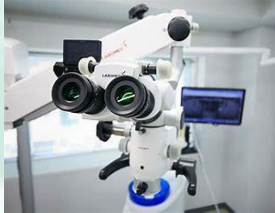
マイクロスコープ