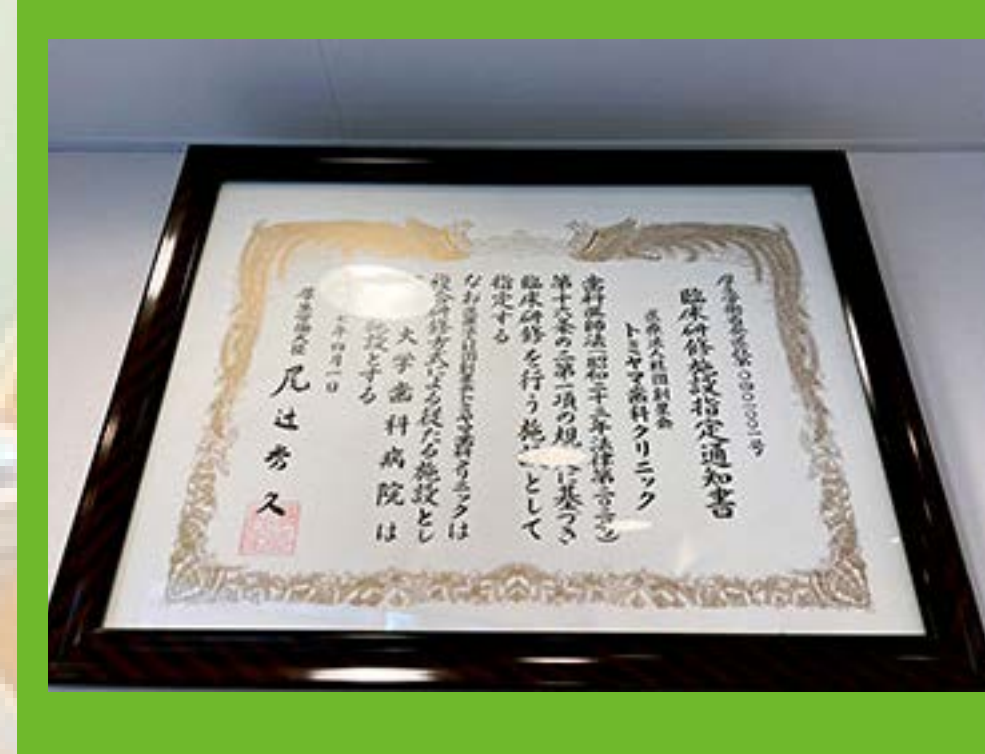
臨床研修施設として認定