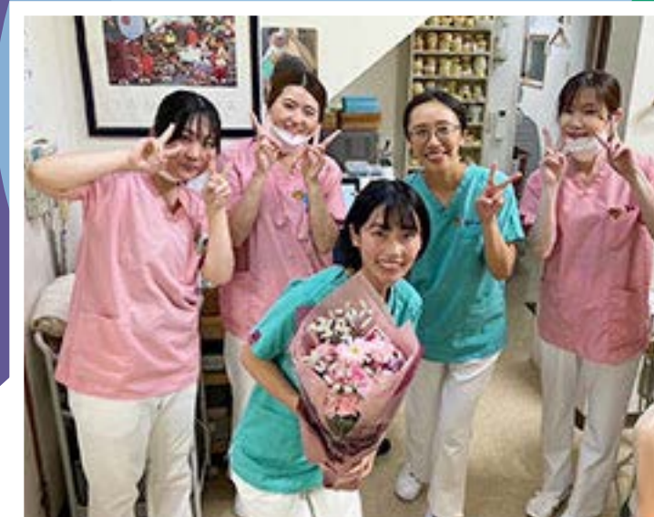
前年度('22)研修修了をした 研修医の先生とスタッフ