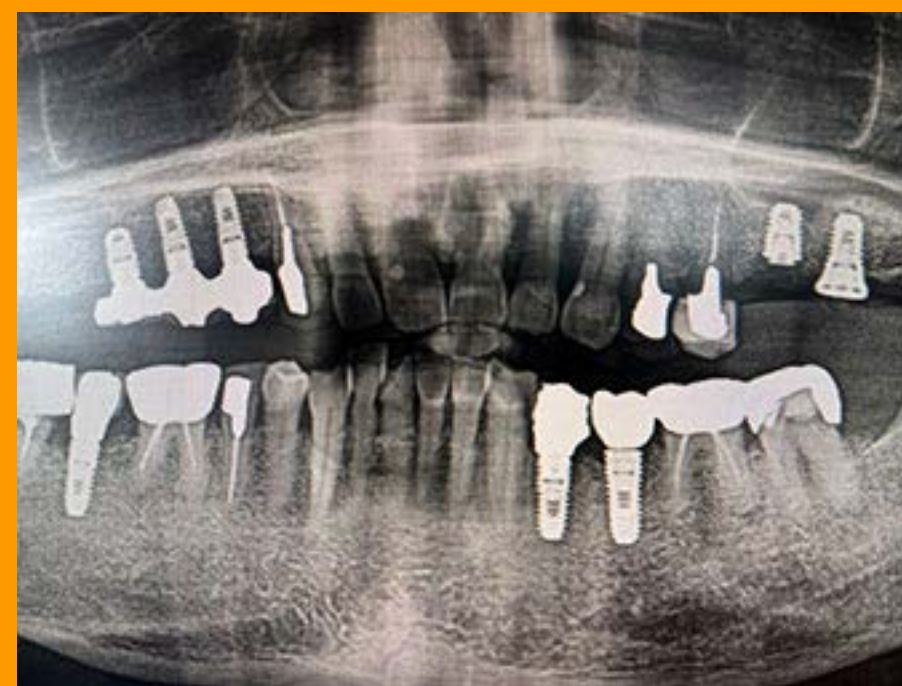
地域に根差しているため、様々なケース の患者様を診察可能