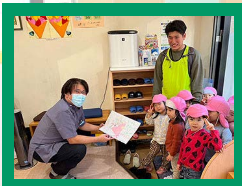
1日30~40人程度の患者様が来院 患者さんとの距離感が近い

トミヤマ歯科クリニックは、旗の台に創業して29年になります。患者様のお口の一生のパートナーとして、長いお付き合いをいただいております。また納得いただける治療を行うことを一番と考え、心温まるコミュニケーションや患者様との会話を大事に努めています。