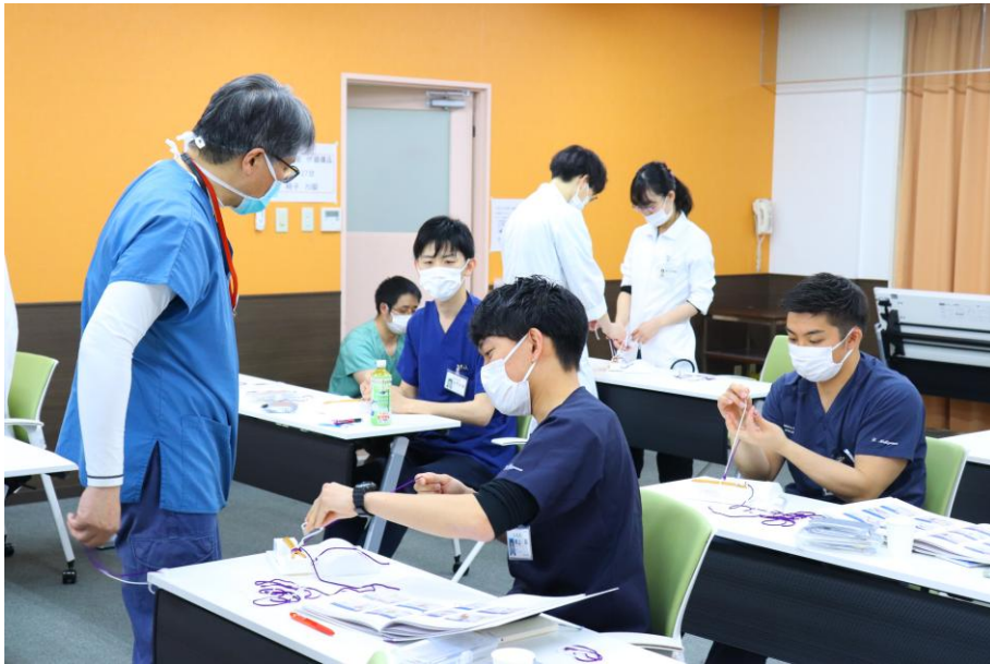
医科と共同のオリエンテーション