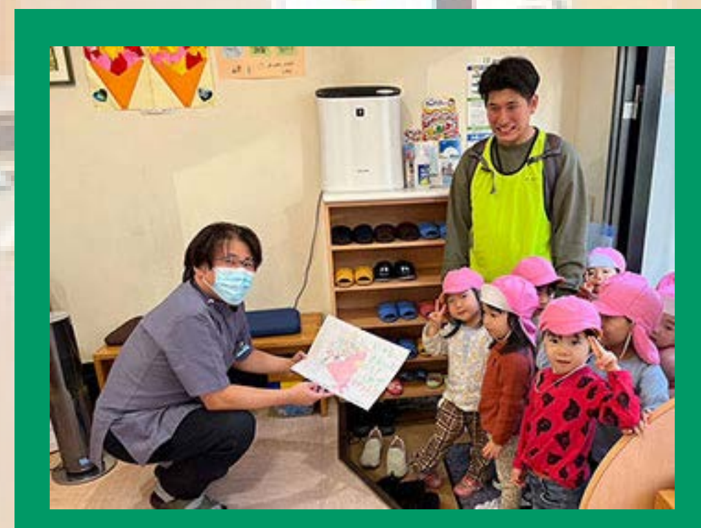
1日30~40人程度の患者様が来院 患者さんとの距離感が近い

トミヤマ歯科クリニックは、旗の台に創業して30年になります。患者様のお口の一生のパートナーとして、長いお付き合いをいただいております。また納得いただける治療を行うことを一番と考え、心温まるコミュニケーションや患者様との会話を大事に努めています。