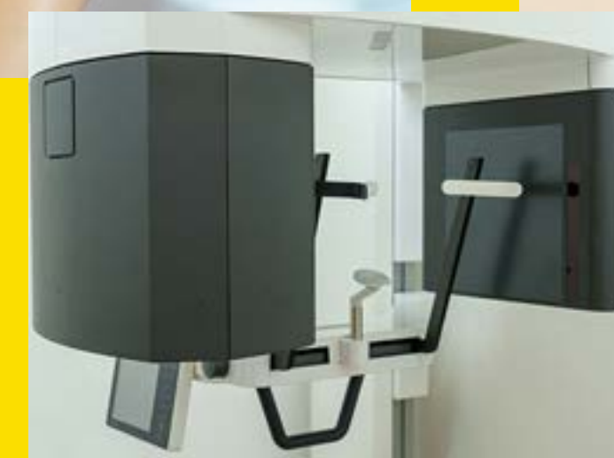
高度な精密検査機器の導入