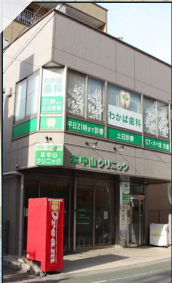
歯科単独型研修施設