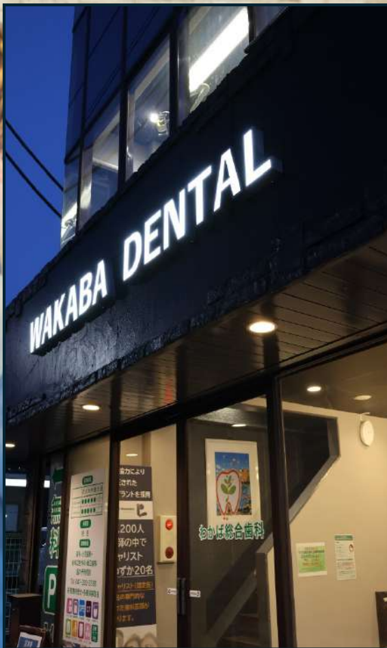
協力型臨床研修施設