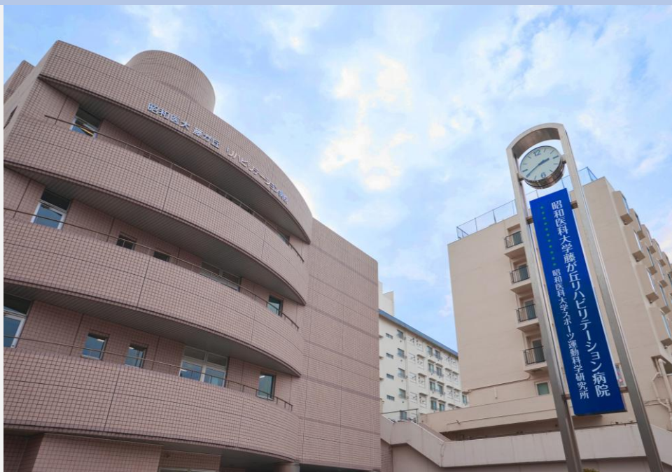
SHOWA Medical University Fujigaoka Rehabilitation Hospital