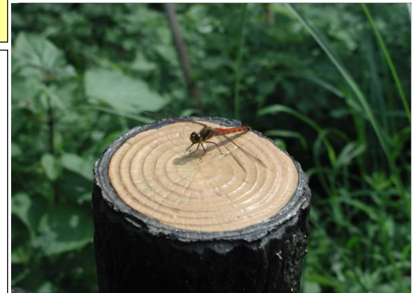
9月の晴れた午後、都筑中央公園にて・・・