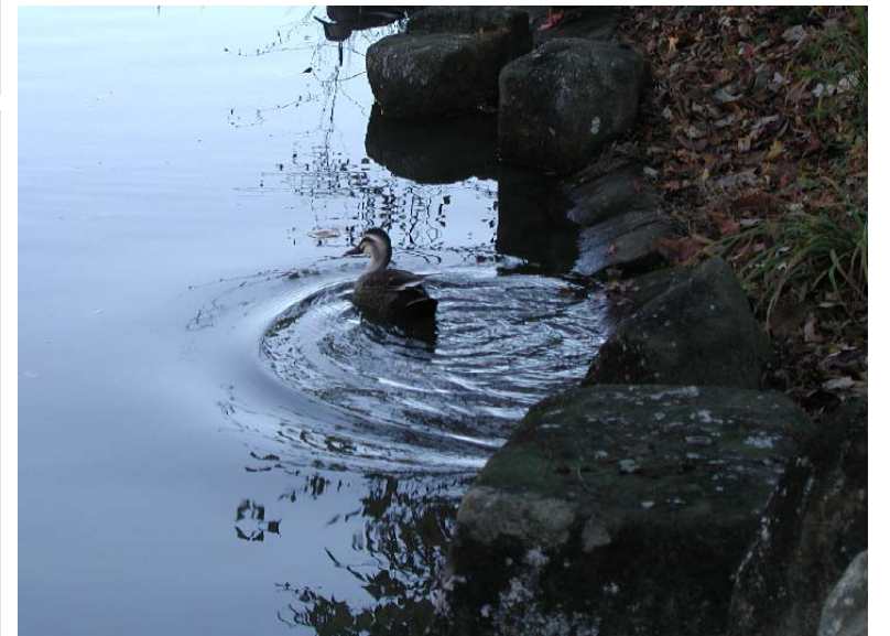
公園の池で羽を休める鴨 都筑中央公園にて・・・