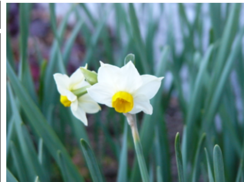
病院の花壇に春の訪れ(日本水仙) 正面入口わき花壇