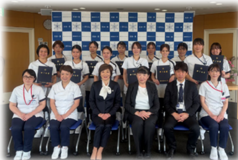
認定助産師修了証書授与式の集合写真