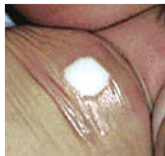
スポンジとフィルム状のテープで圧迫