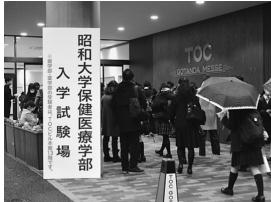
昭和大学保健医療学部 入学試験会場

われしました。志願者は、看護学科296名、理学療法学科66名、作業療法学科25名であり、看護学科が増加しました。学力試験と面接試験の結果、看護学科40名、理学療法学科13名、作業療法学科8名の合格者(特待生)が発表されました。大学入試センター試験利用A方式は、一般選抜入試1期と同日に個別試験(面接)が行われ、看護学科75名、理学療法学科32名、作業療法学科21名の合格者、また、センターB方式(地域別選抜)は、2月11日に二次試験(小論文・面接)が行われ、各地域6ブロックから看護学科8名、理学療法学科5名の合格者(特待生)が発表されました。今年度から看護学科と作業療法学科では、幅広く入学生を受け入れる目的で、