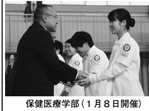
保健医療学部(1月8日開催)