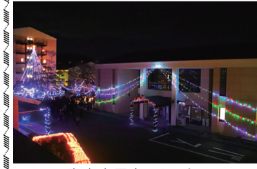
富士吉田キャンパス

イルミネーション点灯式開催 各キャンパスを彩る鮮やかな輝き イルミネーション点灯式が昨年11月26日、旗の台キャンパスで行われた。会場には多くの人が集まり、学生代表3名がカウンタダウンに合わせて点灯スイッチを押すと、中庭を包み込むようにイルミネーションが一面に輝き、集まった人々から歓声が上がった。会場ではイルミネーションをバックに記念写真を撮る人の姿も多く、点灯式を楽しむ様子が各所で見られた。また、11月19日に横浜キャンパス、11月29日に富士吉田キャンパスでもそれぞれ点灯式が行われた。今年も趣向を凝らしたイルミネーションが用意され、多くの学生が集まり点灯の瞬間を待ちわびていた。