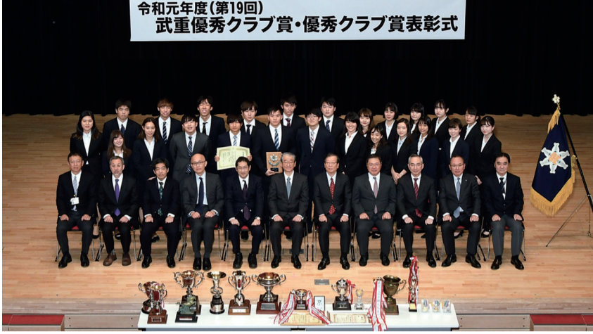
令和元年度(第19回) 武重優秀クラブ賞・優秀クラブ賞表彰式