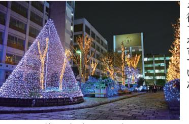
旗の台キャンパス