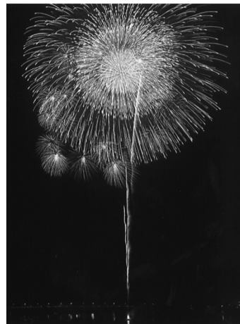
2018年 第102回 河口湖湖上祭「まごころ」

8月5日に開催された第102回河口湖湖上祭の花火大会で、本学協賛の特大自然「まごころ」が打ち上げられた。 河口湖湖上祭は1917年から続く歴史ある祭事で、来場者数約12万人、花火の打ち上げ数約1万発と多くの観光客を楽しませている。