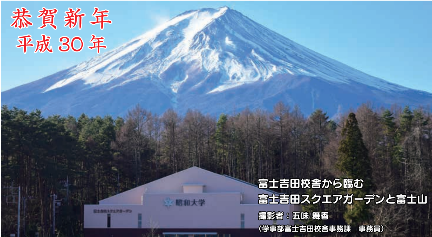
富士吉田校舎から臨む 富士吉田スクエアガーデンと富士山