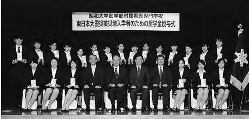
昭和大学医学部附属看護専門学校 東日本大震災被災地入学者のための奨学金授与式