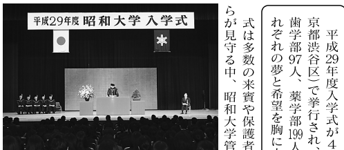
平成29年度 昭和大学 入学式

平成29年度入学式が4月12日、明治神宮会館(東京都渋谷区)で挙行され、新入生577人(医学部119人、歯学部97人、薬学部199人、保健医療学部165人)がそれぞれの夢と希望を胸に大学生生活をスタートさせた。