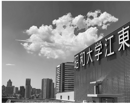
江東豊洲病院 管理課 成田 智貴(江東豊洲病院より)