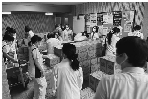
寄贈品を受け取る病院職員

DMATは大規模な集団感染が発生したクルーズ船「ダイヤモンド・プリンセス号」および政府チャーター機による中国等からの帰国者の健康管理を行った昭和大学病院・横浜市北部病院・江東豊洲病院のDMAT隊員に厚生労働省から感謝状が授与された。