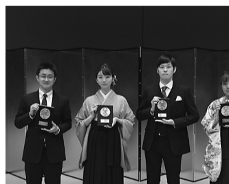
学位記伝達式会場の様子

式典終了後は学位記伝達式が執り行われ、一人ひとりに学位記が手渡された。また、在学中に優秀な結果を残した卒業生に贈られる上條賞、同窓会賞、上條旗ヶ岡賞、上條旗ヶ岡賞功労賞、および最優秀スチューデント・インストラクター賞の授与も行われた。