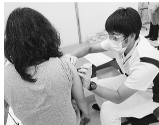
看護師による接種