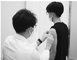
歯科医師による接種