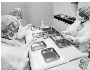
薬剤師による充填

9月6日から10日の5日間、多摩美術大学八王子キャンパスにて新型コロナワクチンの職域接種が実施されるに当たり、本学より医療従事者(医師・歯科医師・看護師)を派遣し、運営に協力した。第1回接種(9月6日)、第2回接種(10月4日、8日)の期間、総勢110名の職員が運営に協力する。