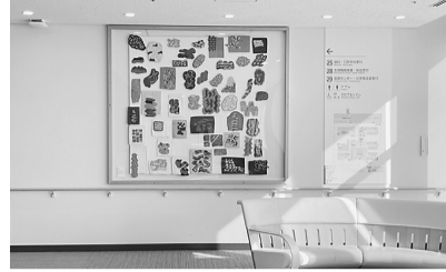
江東豊洲病院2階待合スペース