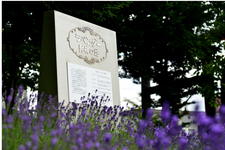
北海道の花と言えばラベンダー。富良野が有名ですが、栽培の始まりは札幌とされています。