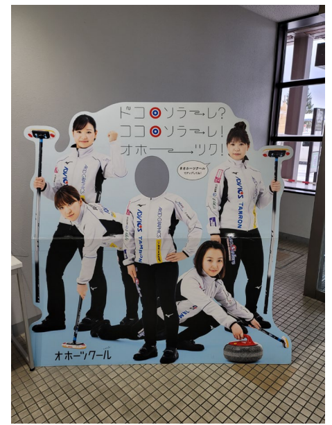
女満別空港では北京五輪代表のロコ・サラールが出迎えてくれます。