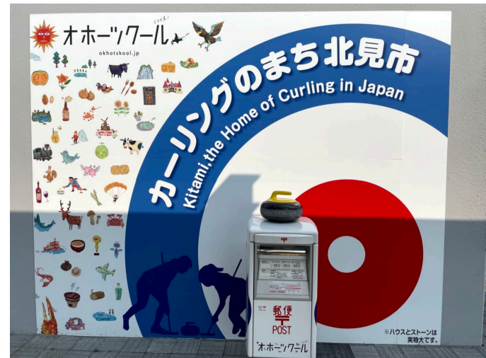
ロコサラールの活動拠点は北見市で私の生まれた町です。駅前の郵便ポストはカーリング仕様。