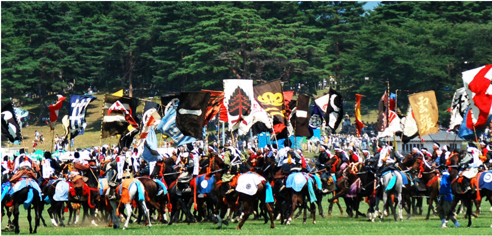
相馬野馬追 約1000年続く祭り 先祖伝来の甲冑に身を固めた400騎の騎馬武者が戦国絵巻さながらに繰り広げる様子は迫力満点です。