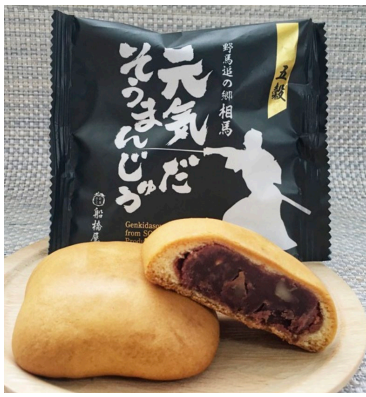
元気だそうまんじゅう 「食べた人に元気に、健康になってほしい」と、5種類の穀物を餡に使用しています。元気になるってほしい人に送っててください。