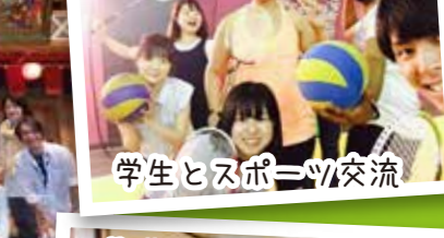
学生とスポーツ交流