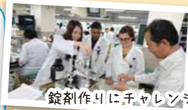
錠剤作りにチャレンジ