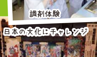
日本の文化にチャレンジ