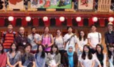
Kabukiza Theatre (Tokyo)